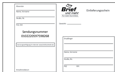
Durchschrift für Ihre Unterlagen

Aktuell bieten wir Ihnen drei verschiedene Paketgrößen an: